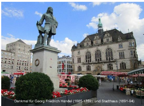
Denkmal für Georg Friedrich Händel (1685-1789) und Stadthaus (1891-94)