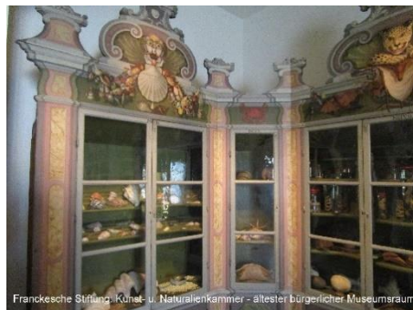
Franckesche Stiftung: Kunst- u. Naturalienkammer - ältester bürgerlicher Museumsraum

Dritter Höhepunkt des Tages ist eine Führung im Geburtshaus des berühmten Barock-Komponisten Georg Friedrich Händel – geboren 1685, verstorben 1759 in London. Er war damit Zeitgenosse von Johann Sebastian Bach. Nach einer einleitenden Führung haben wir genügend Zeit, die Dauerausstellung mit ihren 160 Exponaten und modernen Medien über seine „europäische Karriere“ zu genießen. Das Museum betreut auch das Wohnhaus von Wilhelm Friedemann Bach, das evtl. am 3. Tag individuell besucht werden könnte. Gestaltung des Abends nach Absprache – evtl. Theater-/Opernbesuch.