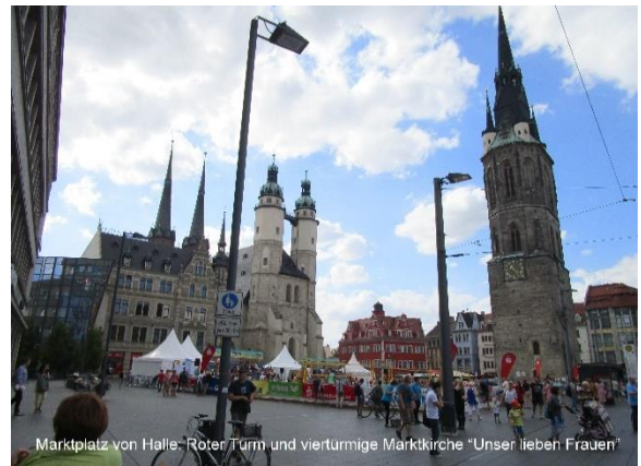
Marktplatz von Halle: Roter Turm und viertürmige Marktkirche „Unser lieben Frauen“

Gemeinsamer Start der Reise ist am Frankfurter Hauptbahnhof. Die Anreise erfolgt mit dem ICE ab 9.02 Uhr in 2 ½-St. bis 11.39 Uhr. Am Nachmittag lernen wir bei einer 2 ½-st. Stadtführung einige der wichtigsten Sehenswürdigkeiten kennen: der Marktplatz mit seiner Silhouette der 5 Türme, die große spätgotische Markt-/Marienkirche mit einem Flügelaltar von Lucas Cranach und der Totenmaske Martin Luthers, der Hallmarkt als ehem. Zentrum der Salzgewinnung (woher ja die Stadt ihren Namen hat), die Akademie Leopoldina, die Martin-Luther-Universität u.a. Gestaltung des Abends nach Absprache.