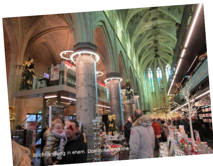
Buchhandlung in ehem. Dominikanerkirche